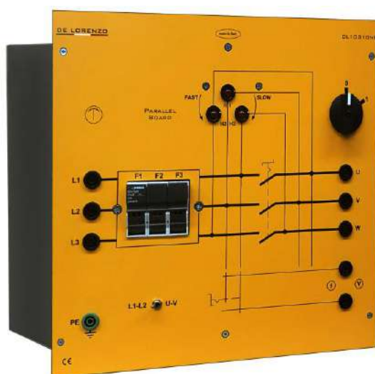
Tavola di parallelo

Sincronoscopio di luci rotanti per realizzare il collegamento in parallelo tra generatori sincroni o l'alternatore e la rete.